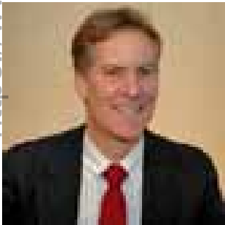
جیفری لانگ ریاضیدان امریکایی

"قرآن این کتاب کریم مرا با قدرت به خود جذب نموده و قلب مرا تصاحب کرد. و سبب شد تا تسلیم خداوند شوم. قرآن خواننده خودش را به آن لحظه ای می برد که فرد به تنهایی در برابر خدایش ایستاده است. اگر قرآن را به جدی نگیری تو نمی توانی آن را به سادگی بخوانی. قرآن بر تو هجوم می آورد گویی او بر تو حقوقی دارد و تو را به مجادله می خواند. تو را نقد کرده و شرمنده می سازد و تو را به مبارزه می طلبد. در حالی که تو در طرف دیگر بودی و برای من آشکار شد که فرستنده قرآن مرا بیش از خودم می شناخته است. قرآن همیشه در فکر از من جلو بود و گویی به پرسش های من پاسخ می دهد و در هر شب من پرسش ها و اعتراضات خود را طرح می کردم اما پاسخ را در روز بعد می یافتم. من گام به گام شخصیتم را در صفحات قرآن یافتم."