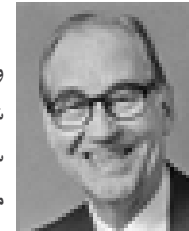
د.مراد هوفمان سفير المانی

و همچنین می فرماید: فرماید: بدینسان بود که آیات ما برایت آمد و آنها را فراموش کردی و بدینسان امروز [درباره] تو فراموشی روا داشته شود (۱۲۶) {سوره طه ایه ۱۲۶}