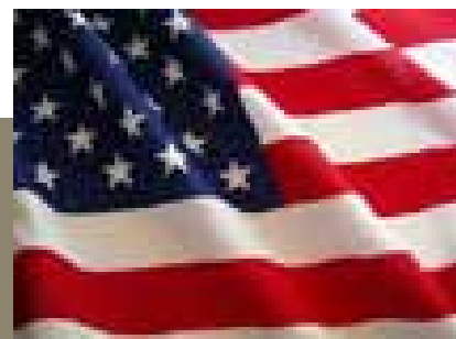
دیورا بو تر روزنامه نگار آمریکایی

چه کسی از مصطفی صلی الله علیه و سلم خواست تا به چنین موضوع گمنامی بپردازد؟ اگر خداوند بلند مرتبه با علم فراگیر خود نمی دانست که انسان روزی به این فهم دقیق از بدن خود دست خواهد یافت. و این نقطه ی نورانی در این حدیث شریف، گواهی بر راستی نبوت این رسول خاتم خواهد شد و گواهی خواهد بود بر درستی ارتباط او با وحی آسمان. اما اگر راه دانش و تمدن در مسیر اخلاق نباشد، آن تمدن نابودگر و آن دانش برای نابودی و سیه روزی و هلاکت و دور کردن مردم از سعادت و بدور از خدمت برای آنها خواهد بود! پس مسیر دانش و تمدن هم مسیر اخلاق است. همانگونه که راه سعادت و خوشبختی بدون دانش و تمدن، خرافه و بدعت گذاری خواهد بود. پس راه و مسیر دانش و تمدن بدون اخلاق، نابودگر افراد و ملتها و جامعه بشری خواهد بود..