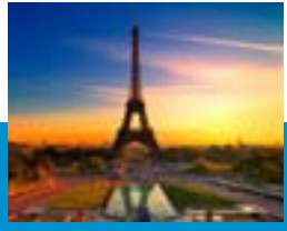
የማያነብና የማይጽፍ መልክተኛ

የሳይንስና የስልጣኔ መንገድ ግን የመልካም ስነምግባር መንገድ ካልሆነ፣ ለሰው ልጆች ተድላና ደስታ የማያገለግል፣ ለጥፋትና ለዕድል ቢስነት የሚያጋልጣቸው የመከራና የዋይታ አጥፊ ስልጣኔና አውዳሚ ዕውቀት እንጂ ሌላ ምንም ሊሆን አይችልም! ስለዚህም የስልጣኔና የዕውቀት መንገድ የመልካም ስነምግባርና የሞራላዊ እሴቶች መንገድም ጭምር ነው። ዕውቀትና ስልጣኔ የሌለበት የደስተኝነትና የመታደል መንገድ ቅገርትና ከንቱ ተረት እንደሆነ ሁሉ፣ መከመልካም ስነምግባርና ከሞራላዊ እሴት የተራቆተ የዕውቀትና የስልጣኔ መንገድም ግለሰቦችን፣ ማህበረሰቦችንና መላውን የሰው ልጅ ለጥፋትና ለውድመት የሚያጋልጥ መንገድ ነው።